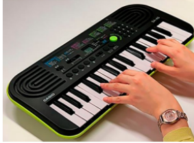
Teclado 32 teclado

Se solicita dentro de lo posible que los estudiantes puedan contar con su propio instrumento musical, aquí van las siguientes opciones: