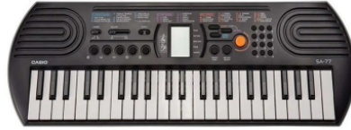
Teclado 44 teclado