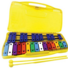
Metalófono 25 Placas